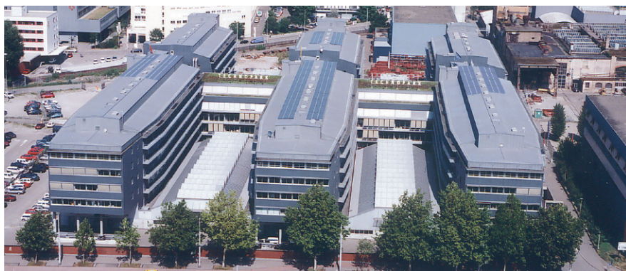
Les coûts d'investissement de la première installation sur le Technopark à Zurich s'élevaient à CHF 9'500 par kilowattheure.